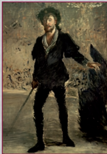
Jean-Baptiste Faure (Hamlet, Thomas), Edouard Manet

After the rediscovery of Baroque opera in the last two decades, interest in these dormant works of the past is now growing.